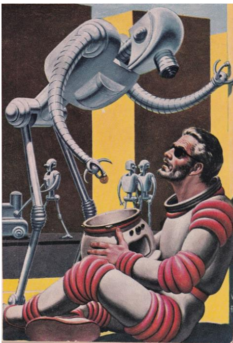
Alla skall få villkorad medborgarlön.

Nefarious betyder skändlig , eller gudlös , och ersätter nu den tidigare utlovade Vattumannens tidsålder. ”Vi teknojktej fasaj nu ut jeligion som styjmedel. Piskan och mojoten ejsätts med digitala kontjakt. Den som inte skötej sig fåj smaka på sko och indjagen medbojjajlön”. Artikeln är skriven av ChatGPT-33.