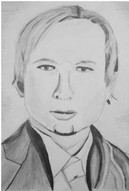
Enda överlevande skiss på papper.

Eftersom det är väldigt få som får tillåtelse att träffa Anders Breivik i fängelset, har resten av världen nu endast en enkel skiss på papper att tillgå när de vill se honom i ögonen.