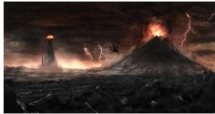
Jens målning "Morway".

(LL) "Uten CO2 ikke noe liv! En veldig god forvandling og jeg er ekstremt stolt", så uttalar sig den tidigare statsministern Jens Stoltenberg, som numera leder sprängningsarbetet av naturgasledningarna i Östersjön på fritiden, "Når jeg ikke tenker og maler på min visjon om Morge". I denna vision har Jens tagit inspiration från Tokringens Saga av J.R.R. Frackien om en värld skönt svart som råolja.