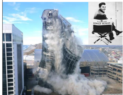
Jordskredsseger för Hulk i Trump Plaza.