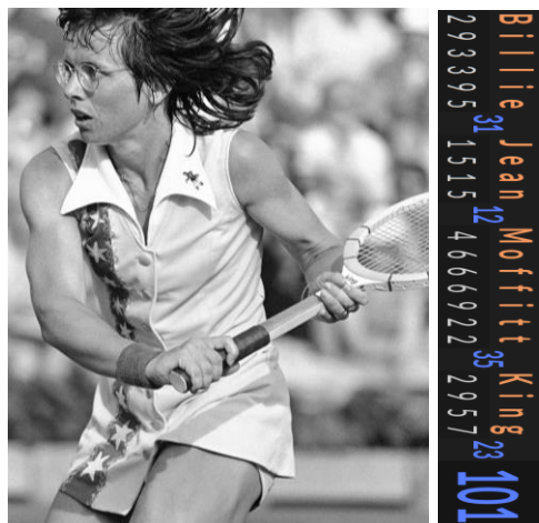
Slagkraftige Billie King.

eller han, rankades 1966–1968, 1971 och 1974 som världsetta, och låg tack vare sina starka gener kvar på plats 13 som 40-åring. "Kromosomer är tydligen en bluff, det är jag ett levande bevis på", säger 80-åringen.