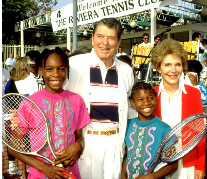
Bröderna Williams som barn.

Bröderna Venus och Serena är till stor del en skapelse av deras far Richard Williams som började drilla dem vid 4 års ålder. Serena, här i blått, tillsammans med storebror Venus i rosa (en vit skådespelare mellan dem).