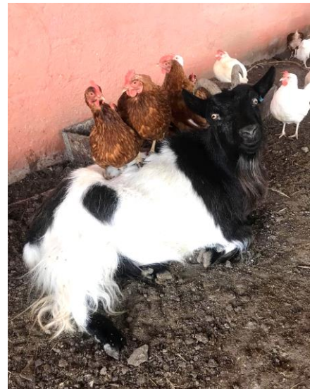
En get & Co på Pullans hönseri.

Ta med lite fika och matsäck, samt en kylväska för de specerier som du kanske råkar inhandla på resans gång!