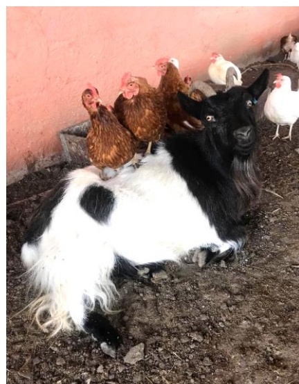
En get & Co på Pullans hönseri.

Ta med lite fika och matsäck, samt en kylväska för de specier som du kanske råkar inhandla på resans gång!