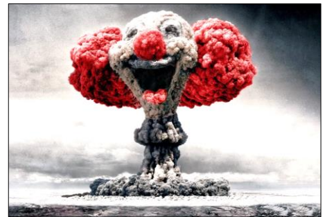
En elak clown träder fram ur svampmolnet.

I denna del av evenemanget kikar vi på kärnvapen-revisionismen – som verkar ha startat på internet 59 år efter den första atombomben och som nu börjar nå ut på bred front även hos en aktör såsom Joe Rogan.