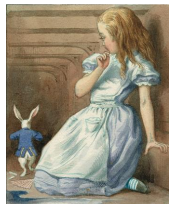
Alice i Lewis Carrolls kaninhål.