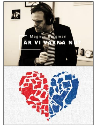
Söndra för att härska – klassikern.