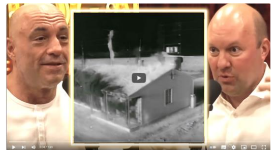
Joe Rogan: FEJKADE dom gamla kärnvapenprov?!

DET ÄR DEN GAMLA VÄRLDEN SOM FALLER (och det ska göra dig fri): youtu.be/eMMkj3_p_NI?si=NizEtCFotIFc6-Ur